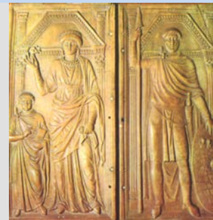
Teodosio I y su familia Relieve en marfil (S.V d.C.)

También fue muy importante la tarea de conservación y comentario de las obras del helenismo clásico . Entre los comentaristas se pueden señalar Eustacio de Tesalónica (comentarista de Homero) y Focio (autor de Myriobiblon , donde detalla los 280 volúmenes que componían su biblioteca, y que ha permitido tener noticia de muchas obras ya desaparecidas).